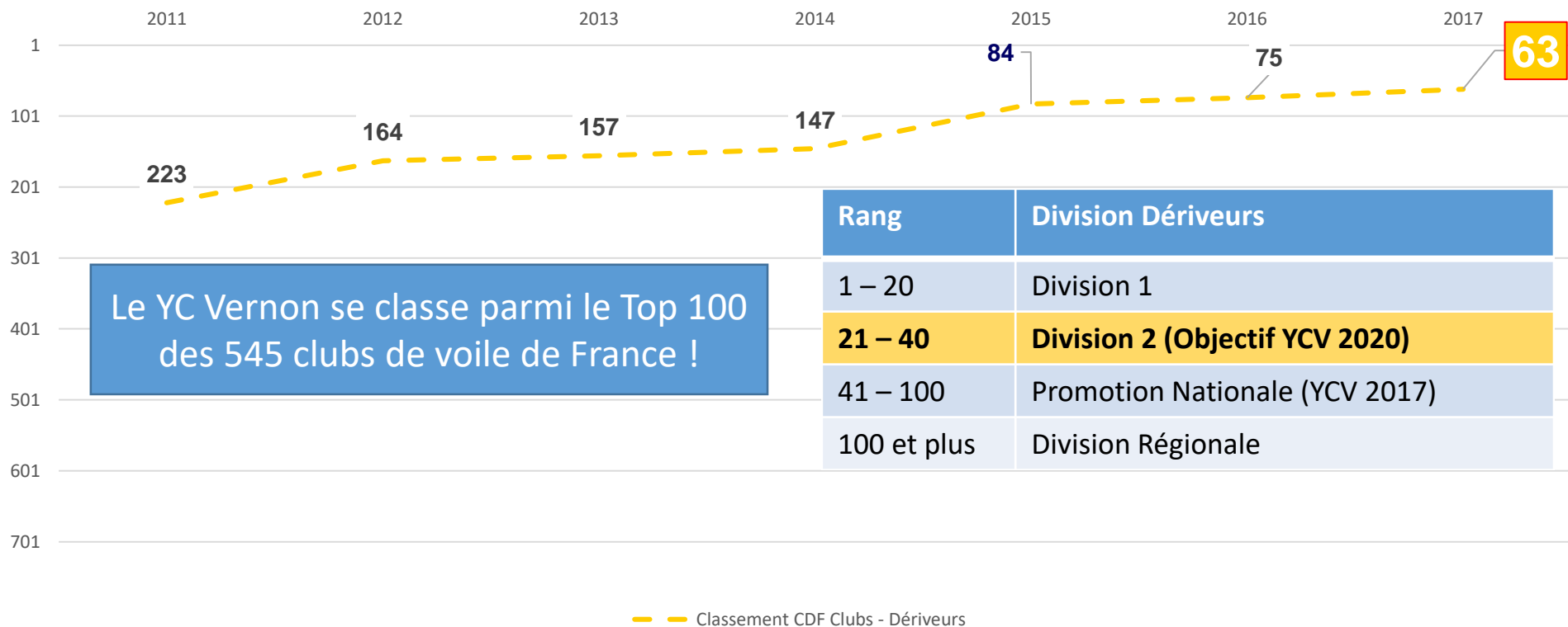
Classement NATIONAL du YC Vernon